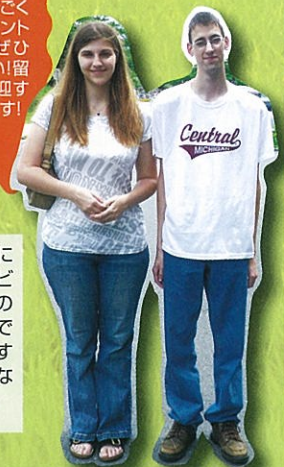
※一部の画像はHPより引用しています。