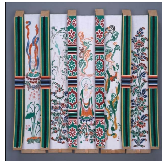
右: // 支輪部にみる原寸大彩色復元 (いずれも律宗総本山 唐招提寺蔵)