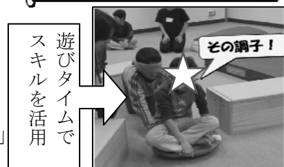
遊びタイムでスキルを活用