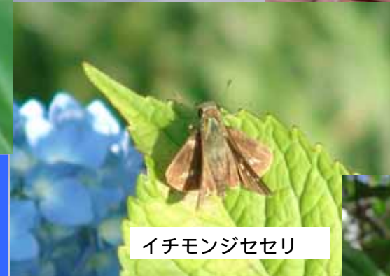
イチモンジセセリ