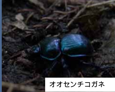
オオセンチコガネ