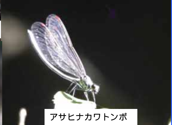
アサヒナカワトンボ