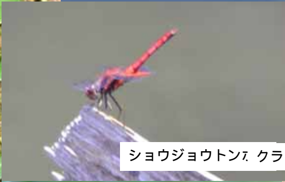
ショウジョウトンボ クララ