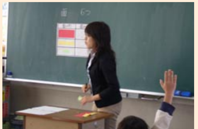
校内の研究授業で

大なわは子どもたちに人気のある遊びの一つです。チームで決めた目標をみんなの力で達成できたときの喜びほど大きなものではありません。しかし、中には、跳びたくてもなわに入るタイミングがつかめず困っている子もいました。そこで、昔の遊び歌を周りの子どもたちみんなが歌い、自然にリズムに溶け込めるよう応援することにしました。すると、今まで跳べなかった子が