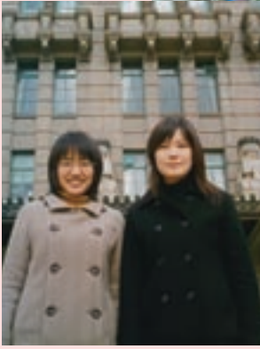
市役所前で同期と