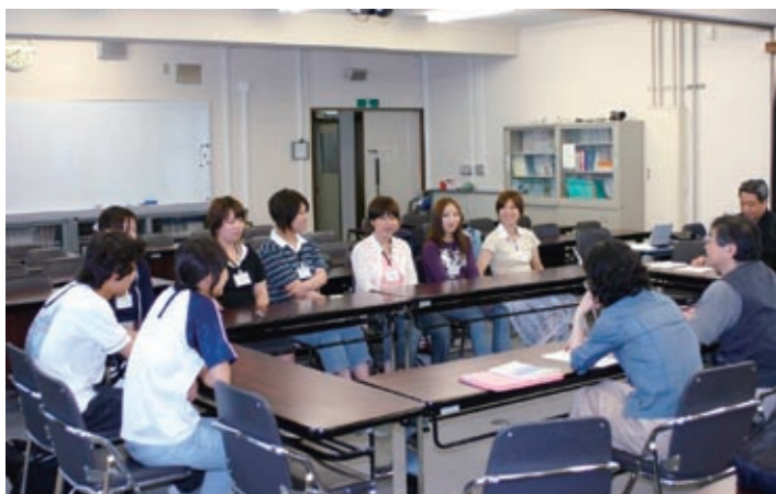
地域推薦入学者との懇談会

・空きコマを利用して勉強しているので、空き時間がある方がよい。 ・奈良県の教師を目指す人には地域推薦を勧める。