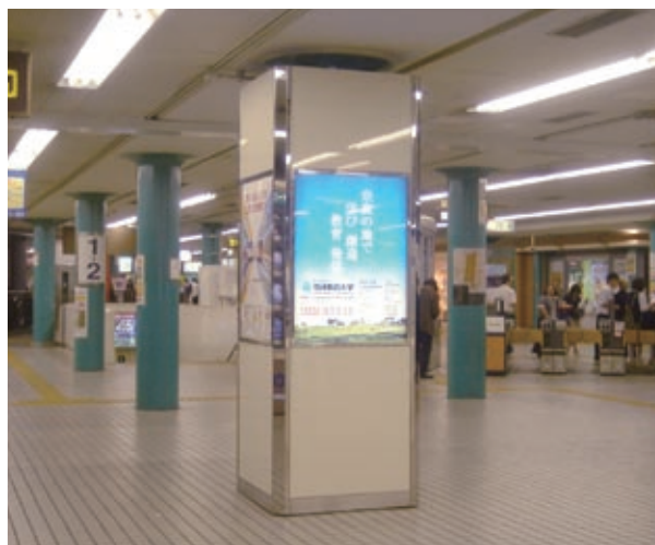
奈良の地で、学び 創造、教育 発信

また、国立大学法人になって一層広報活動にも力を注ぐようにしていきます。例えば、近鉄奈良駅構内に広告パネルを設置したのもその一環です。写真のようなキャッチフレーズを見ていただいたでしょうか。