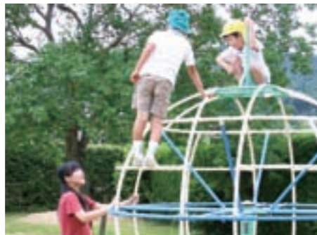
〈実習初日〉「好きな遊び」の時間。少しでも多く子どもたちに声をかける。

教育実習生は、年長組、年中組、年少組と、それぞれの担当にわかれ、約1ヶ月の間、実習校で保育実習を行う。 教育実習は、これまでに学生たちが大学で学んできた理論などを実践すると同時に、現場で日々、子どもたちの保育を行っている教師らから多くのことを学びとる貴重な機会でもある。