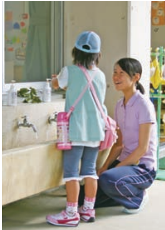
〈実習初日〉初めての顔合わせ。あいさつもどこかぎこちない。