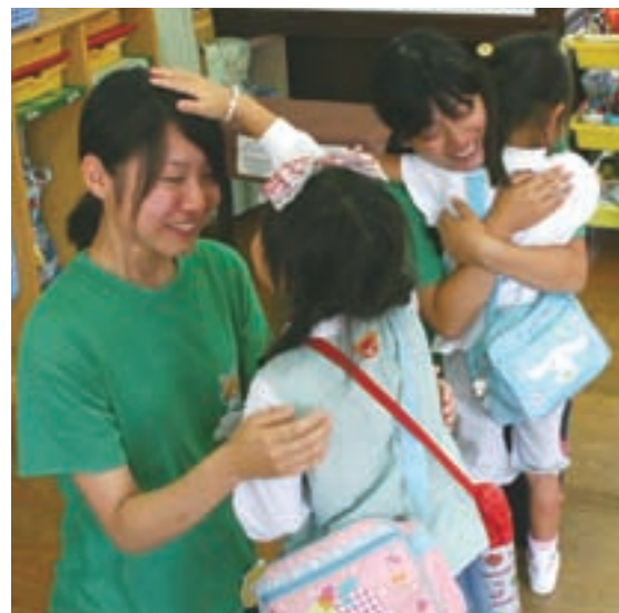
〈教育実習最終日〉子どもたちと別れを惜しむ。