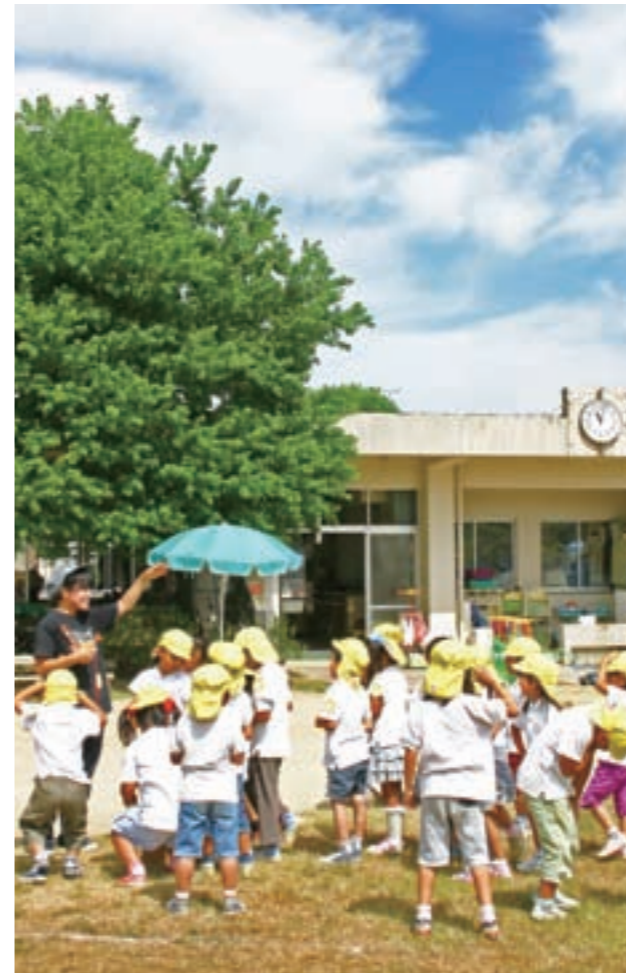
園庭での保育では、実習生の大きな声が響いていた。

はじめは多くの実習生が作成に苦労したと明かす。しかし実習を終えると、保育の意味、その日の「ねらい」を明確にするために、保育指導案はとても大事だったと全員が口をそろえる。