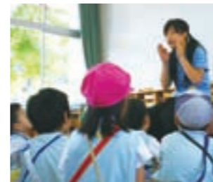
〈部分保育〉時に小さな声の方が子どもの関心をひくことを学び、実習生たちは実践していた。