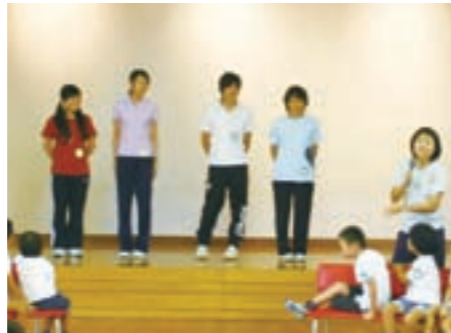
〈実習初日〉遊戯室で開催された誕生日会の後、子どもたちに実習生が紹介された。