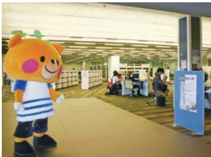
広々として落ち着いた雰囲気の内。