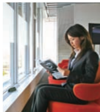
インテリアにも快適さへの気配りが感じられる。

もともと奈良県文化会館内にあった県立奈良図書館と、橿原公園内にあった県立橿原図書館を統合して、2005年11月にここに設置されたので、今年で5年目になります。