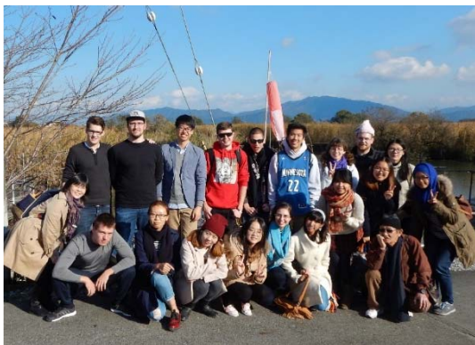
学習旅行(近江八幡)