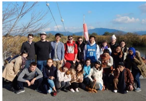
Field Study Trip (in Oumihachiman)

Also Nikkensei have to take a chest X-ray in Japan, too.