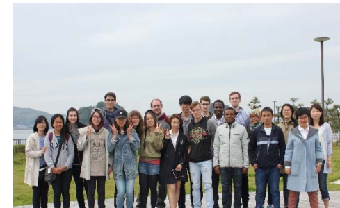
Field Study Trip(in Toushi Island)

Professional occupations at educational departments of domestic and international institutions. Employment opportunities at miscellaneous corporations or companies in Japan or students' countries which require Japanese language proficiency.