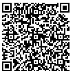
傷害予防塾申込用QRコード