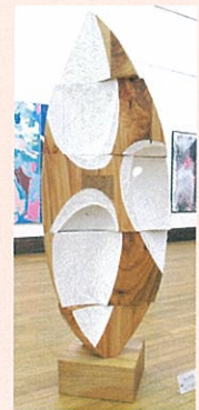
山下圭介 「huma」 【第44回関西国展関西国画賞受賞作品】