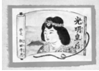
手作り絵本『光明皇后』(表紙)