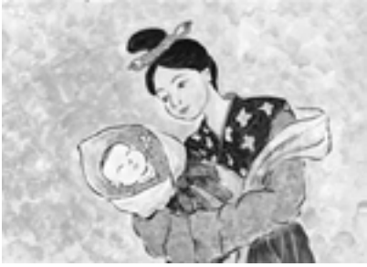
701年 光明子が生まれる