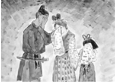
男の赤ちゃんが死ぬ