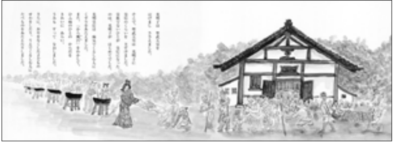
光明皇后は苦しむ人たちを救う