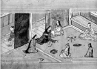
奈良絵本『鳥帽子折』