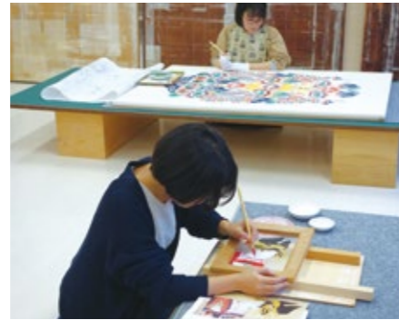
彩色文様の復元実習