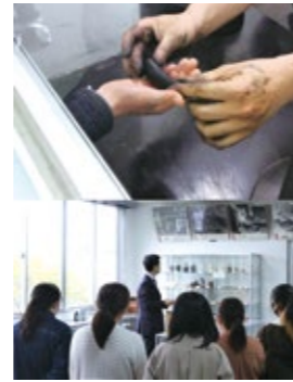
(株) 墨運堂における見学風景