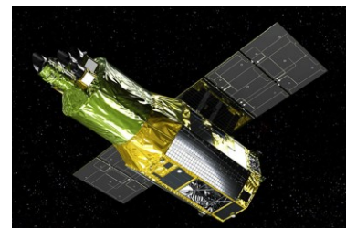
図2 X線天文衛星 XRISM

近く打ち上げるX線天文衛星 XRISM（クリズム）（図2）を使って、新たな観測を行います。ブラックホール成長の謎の解明だけでなく、誰も見たことがない宇宙を発見することも期待しています。