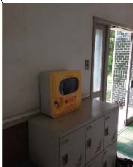
AED設置場所（管理棟入口すぐ右手）