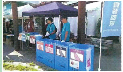
天神祭ごみゼロ大作戦エコーション運営