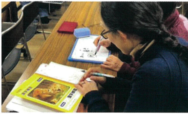
識字・日本語教室の学習パートナー