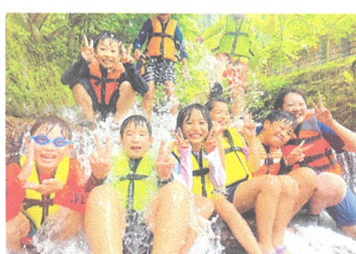
びしょめれでわらった夏は ずっと心にのこる。