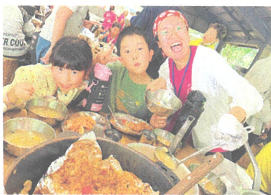
いっしょにつくるごはんは いちばんおいしい。