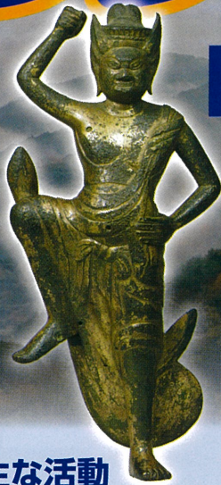
「山の神様」とされる 「蔵王権現立像」 奈良国立博物館所蔵