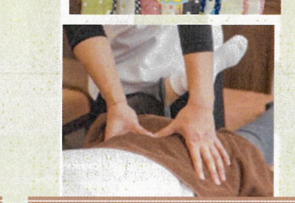
カイロサロンなかよし