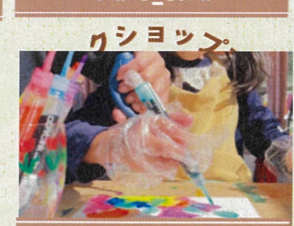
ええやんの筆と色・ミナ